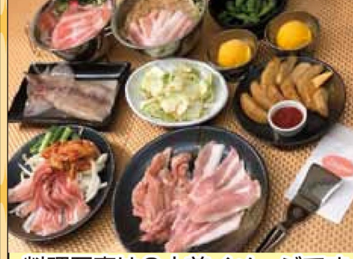
料理写真は2人前イメージです