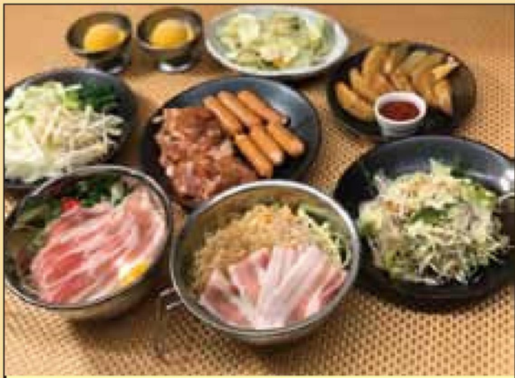
料理写真は2人前イメージです