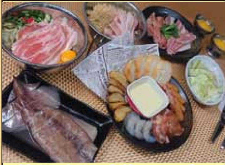
料理写真は2人前イメージです