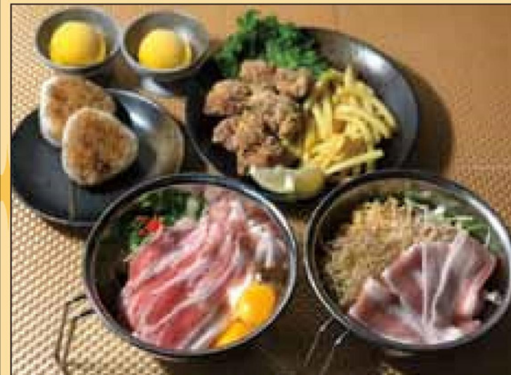
料理写真は2人前イメージです